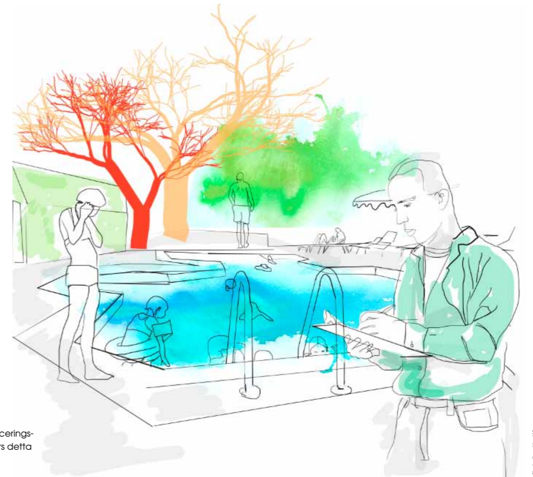
Illustration: Lisa Wigen

SCR genomför de sista klassificeringsbesöken i egen regi. 2013 görs detta i samarbete med Visita.