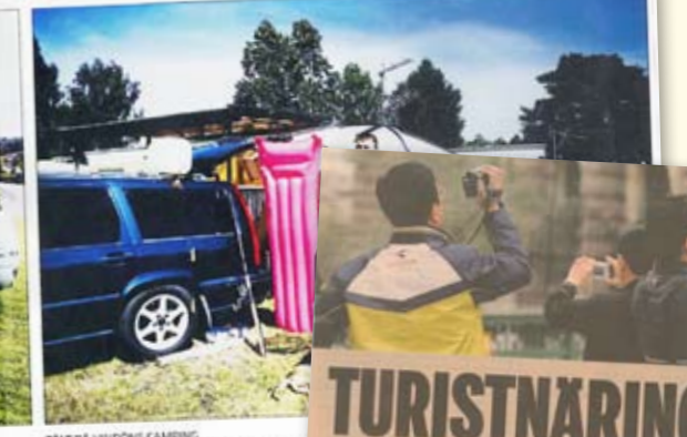
TÄLT PÅ VINDONS CAMPING

Här blev det rekord för campingbranschen i Sverige. Detta innebär att campingbranschen har ökat sin andel av den svenska turistmarknaden från 1,5 till 2,5 procent.