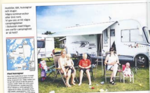
HURBIL PÅ STOCKENS CAMPING

Nytt stjärnsystem i campingvärlden Självar betygsättning av campingplatserna är ett nytt sätt att bedöma deras kvalitet. Detta innebär att campingbranschen kan ge sina kunder mer information om vilka platser som är de bästa.