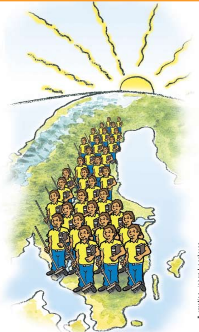
Illustration: Johan Henriksson