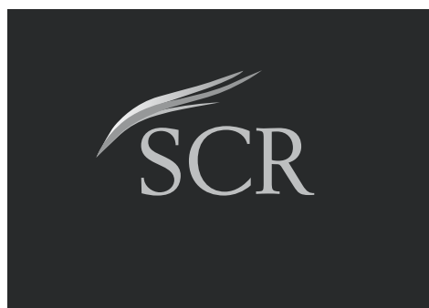
SVARTVIT LOGOTYP UTAN PAYOFF MOT SVART BAKGRUND